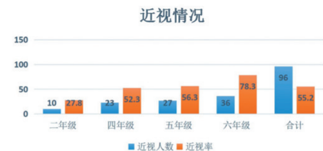
南京市琅琊路小学学生近视情况统计图

2.青少年近视户外活动干预。上海市眼病防治中心团队通过综合文献研究显示,每天额外增加76分钟的户外活动时间,可以降低50%的近视发生,可以改进学校教学形式,保证学生在校期间每天不少于1小时的户外活动时间;